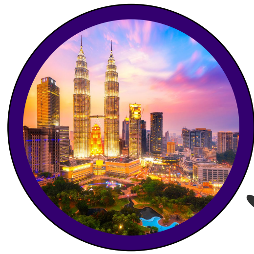
Kuala Lumpur, Malesia