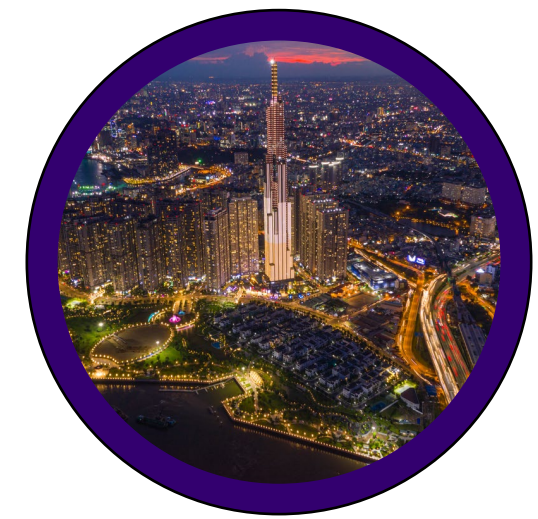
Ho Chi Minh, Vietnam