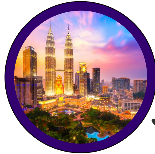
Kuala Lumpur, Malesia