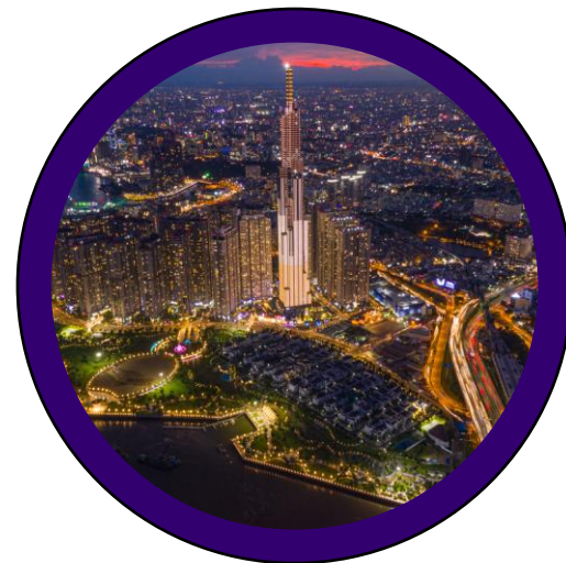
Ho Chi Minh, Vietnam