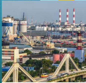
Zona industriale: Jurong