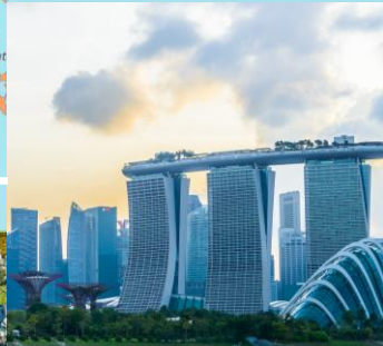
Zona commerciale e di intrattenimento: Marina Bay Sands